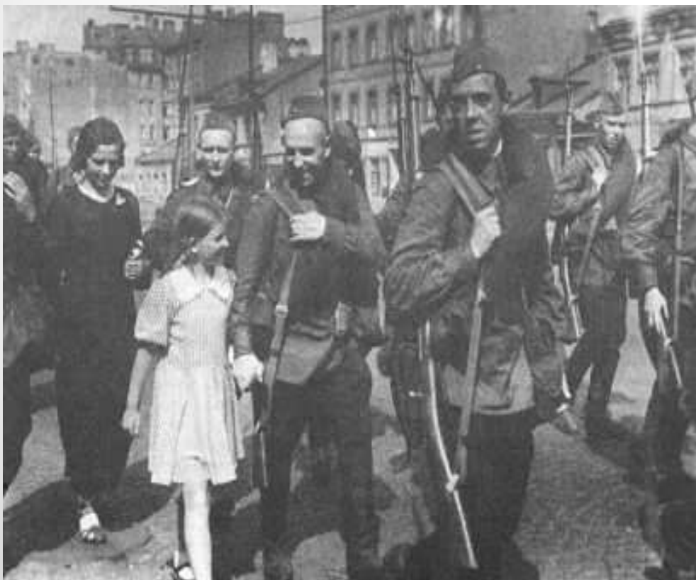
Проводы ленинградских ополченцев. Лето 1941.