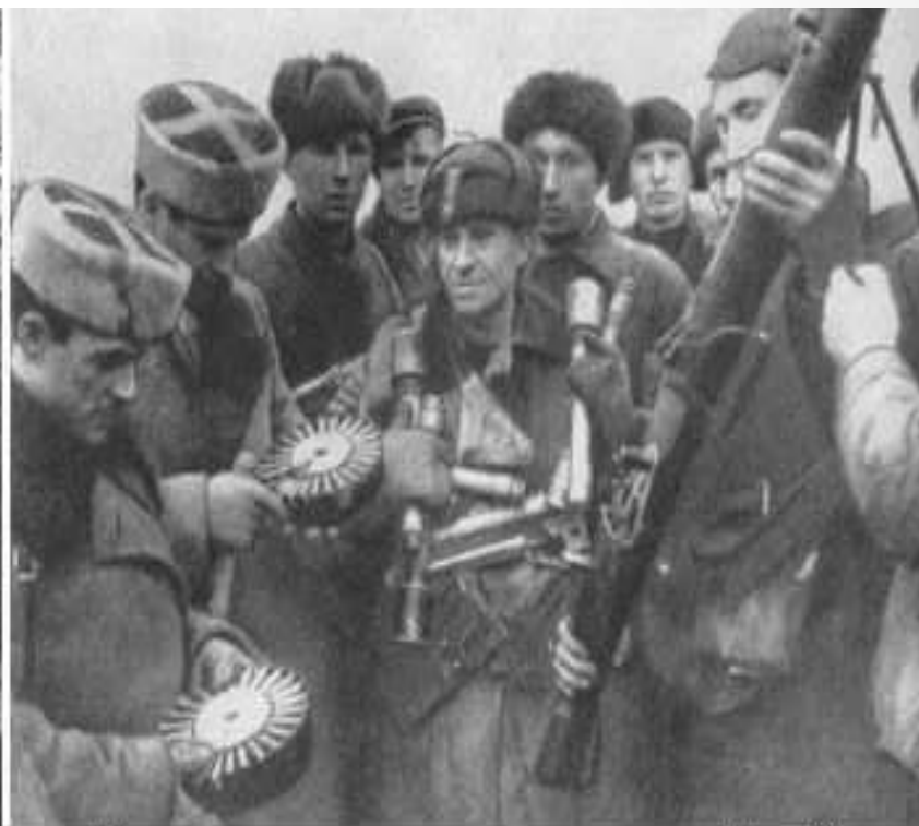
Ленинградские ополченцы под г. Лугой изучают ручной пулемет Льюиса. Лето 1941 г.